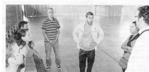
Sarela y SD Compostela, unidos en un atractivo proyecto COLABORACIÓN La SD y la Asociación de Daño Cerebral de Compostela Sarela han unido fuerzas para llevar a cabo un proyecto en el que el club blanquiazul formará deportivamente a un grupo de jóvenes con daño cerebral. En el Cadeiro, recinto del cadete local, fue presentado en el pabellón de D Restalá a sus nuevos pupilos. www.sarela.es