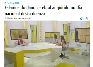
A Revista FDS Falamos do dano cerebral adquirido no día nacional desta doenza Publicado en www.findefsemana.com