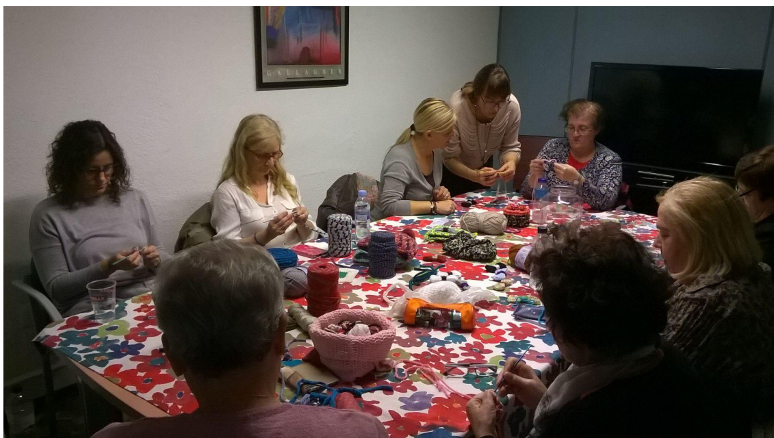
Taller de Crochet 2015