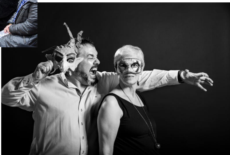
Una de las fotografías que aparecen en la exposición.