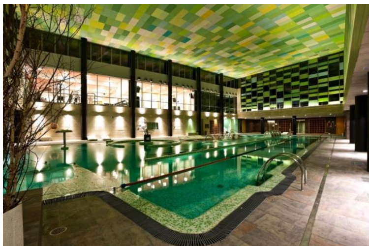
Centro Hidrotermal de Ranillas.