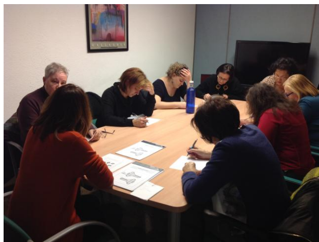
Taller de memoria 2015