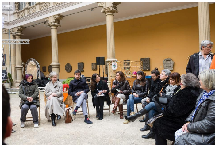
En el Mercado del 13.